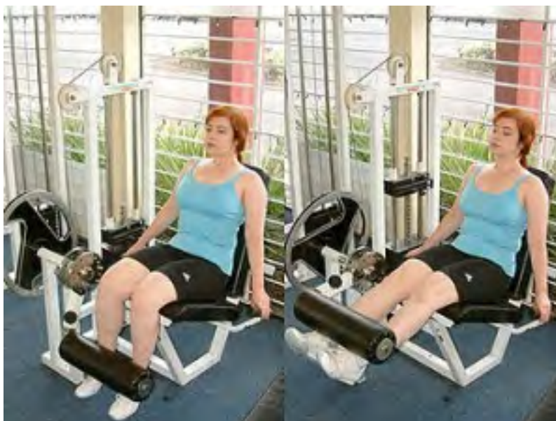
Não foi Feito para a Celulite: Exercício de Extensão da Perna

A maioria das mulheres tem celulite na parte de trás das coxas, pernas e bumbum. Uma porcentagem menor as tem na parte da frente. Então este movimento não é apenas uma perda de tempo porque ele é feito para concentrar-se nos músculos frontais da coxa, mas ainda mais por ser um tipo de exercício de único conjunto, isolamento. Muito raramente há um motivo para uma mulher usar esse tipo de equipamento. A energia e esforço são melhor gastos em exercícios de 'combinação' que envolvem duas ou mais juntas e requerem uso e estimulação de diversos grupos de músculos em vez de apenas um.